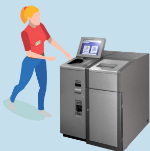
OPERADOR DE CAIXA