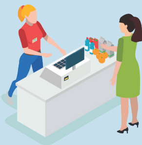
OPERADOR DE CAIXA