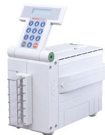
PERTOCHEK Impressora de Cheques