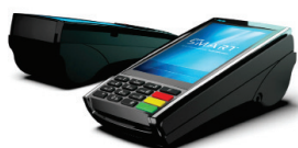
VELOH SMART Terminal POS