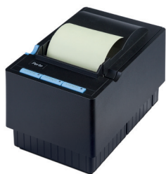
PERTOPRINTER Impressora Térmica Não Fiscal