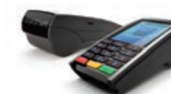
VELOH terminal pos