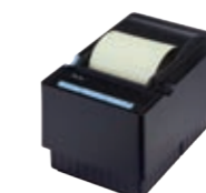
PERTOPRINTER impressora térmica não fiscal

A menor impressora da categoria proporciona economia comprovada na compra de papel, pois permite o uso de uma bobina maior (até 130 metros).