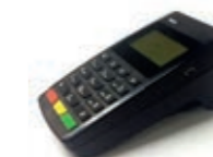
MCOM terminal multifuncional