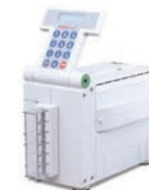
PERTOCHEK impressora de cheques